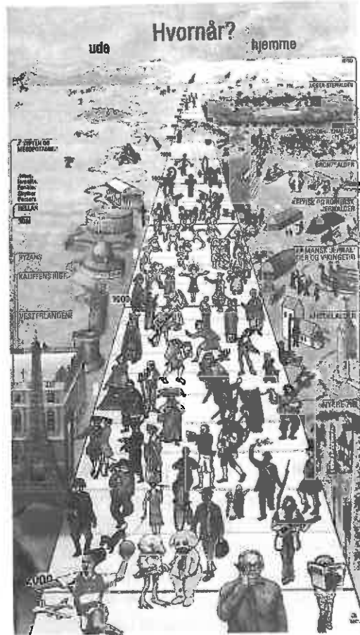
Historie er lig med fortid(en) – dvs. noget, der betragtes oppefra og udefra

Da Bertel Haarder blev undervisningsminister i efteråret 1982, tog han straks initiativ til at få ændret ved hele måden, hvorpå historiefaget